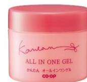
コープ かんたん オールインワンジェル B

「コープ かんたん」のラインナップには、日焼け止め効果のある「コープ かんたん オールインワンジェル UV B」の他に、夜のケアに使用できるパック効果を併せ持つ多機能スキンケア「コープ かんたん オールインワンジェル B」(ピンクのパッケージ)も発売しています。また、5月1日からは、大容量のチューブタイプの「コープ かんたん オールインワンジェル UV B」(150g・1,430円/税込)を発売。朝のケアも夜のケアも1品だけ簡単でお得に完了。タイパとコスパを実現し、シンプルスキンケアを叶えます。