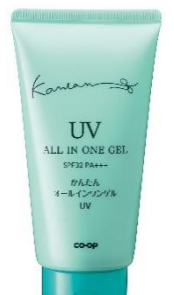
コープ かんたん オールインワンジェル UV B チューブタイプ